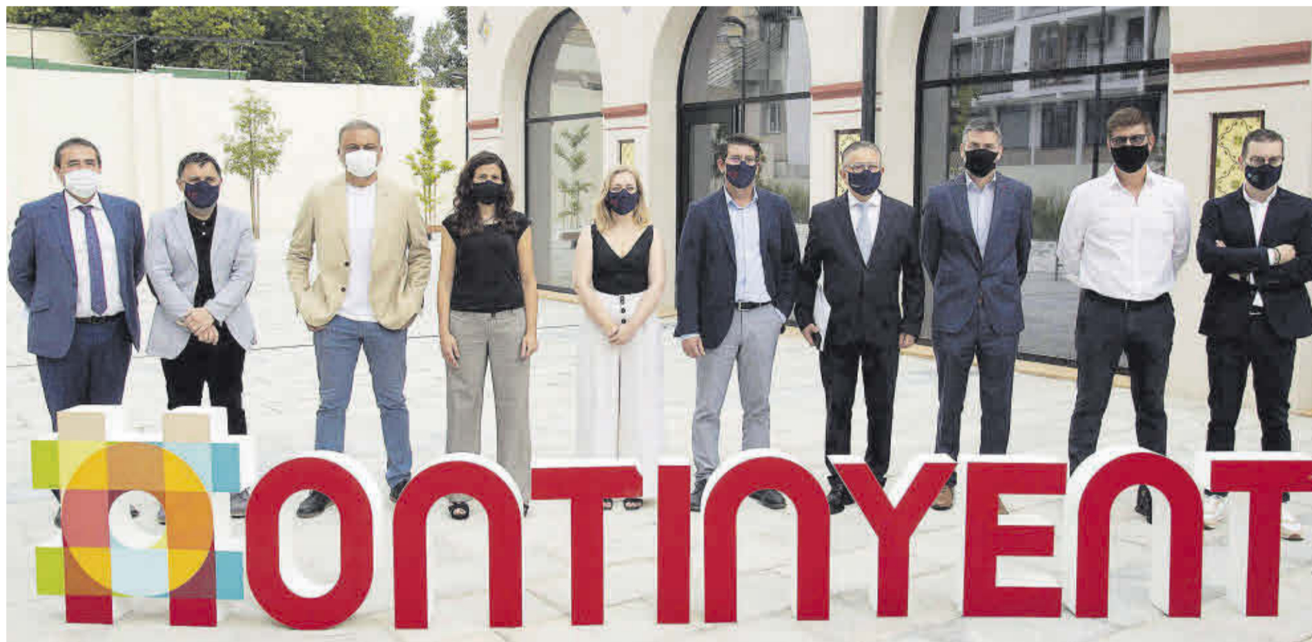
Los participantes en el foro económico «el clúster textil como motor de las comarcas centrales» posan antes del encuentro en una fotografía de grupo.